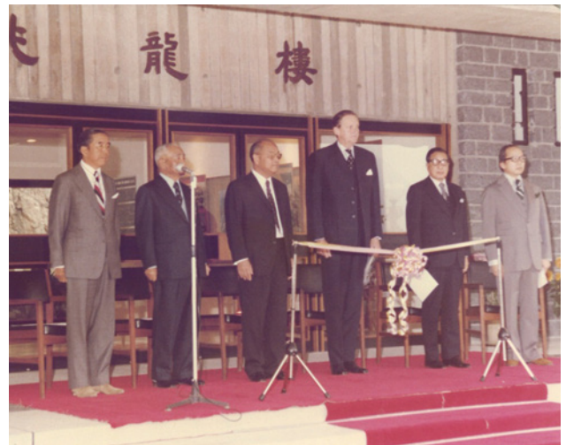
1978年，香港中文大学包兆龙楼开幕典礼

包玉刚先生曾以深具开创性与变革性的行动，为推动香港及内地教育事业的发展作出卓越贡献。他不仅捐资创办宁波大学、设立“中英友好奖学金计划”，亦为上海交通大学捐建图书馆，并在浙江大学、香港大学、香港中文大学等校设立奖学金与国际交流项目，以其远见与仁心，点亮了无数求学者的前行之路。