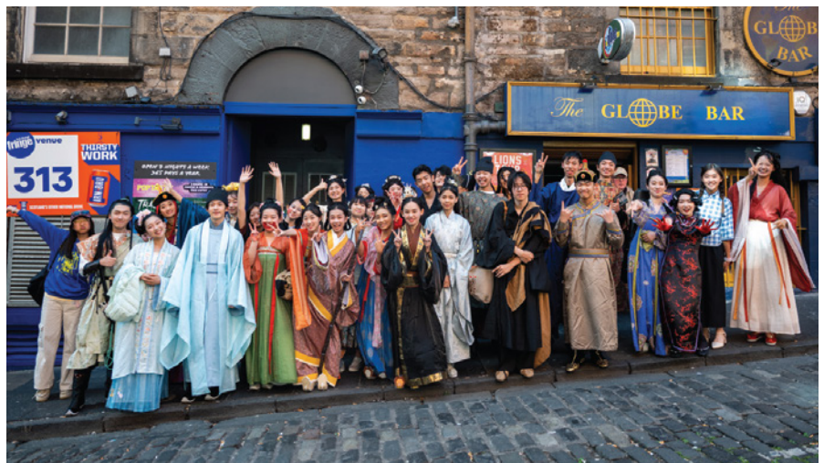
上海包玉刚实验学校的学生们亮相于2025年爱丁堡国际艺术节，呈现东西方文化交融的创意表演。