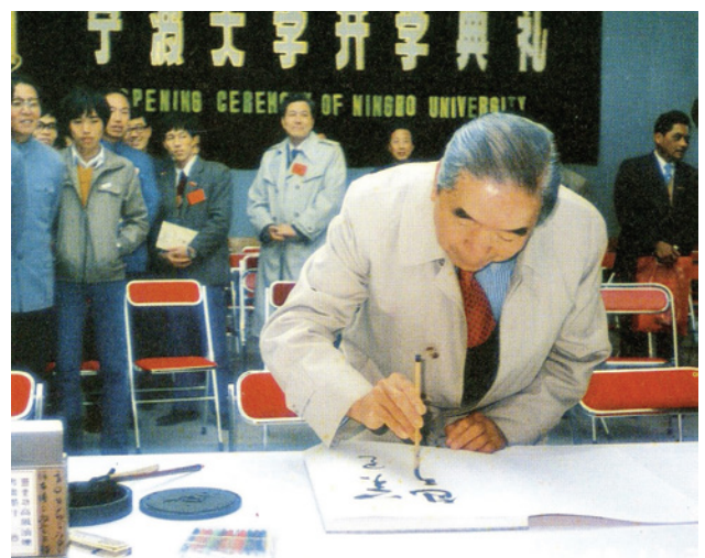
包玉刚先生为宁波大学开学典礼题词